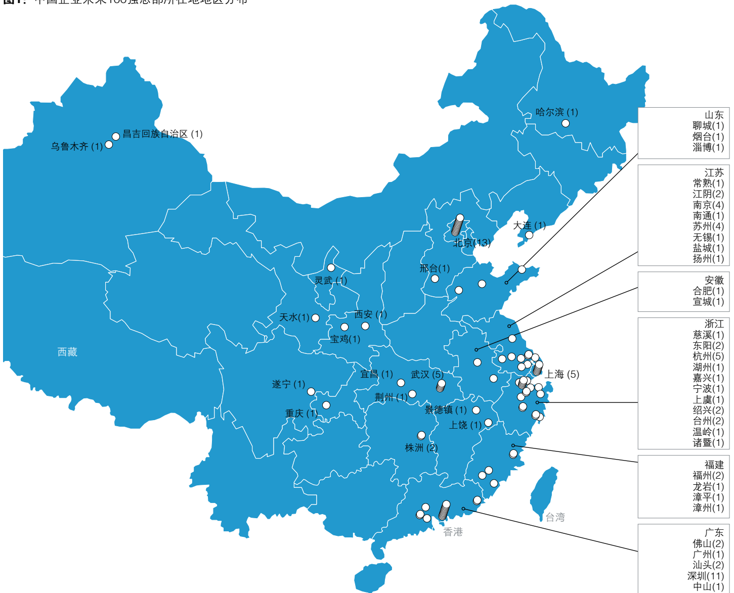
图1: 中国企业未来100强总部所在地地区分布

这些企业遍布中国各地,但仍以位于各大主要城市为多——特别是北京、上海、深圳和武汉(表1和图1)。100强企业广泛地遍布于中国各地。很多公司将总部设在大城市或东部沿海,这体现了这些区域的经济发展水平。但是我们也注意到,新兴全球巨头的分布有向南转移的趋势。2014年的榜单中,七家企业的总部设在深圳,而2016年达到了11家;同时,总部位于北京的企业从17家减少为13家。这反映出,由于同香港和全球经济密切相关、具备前海等国家级开放平台、高新科技产业发展资源,深圳的经济地位正在不断提升。